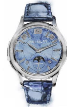
Blaues Wunder Minutenrepetition, Tourbillon und ewiger Kalender verbergen sich in Patek Philippes „Grandes Complications 5207“. Preis auf Anfrage. patek.com