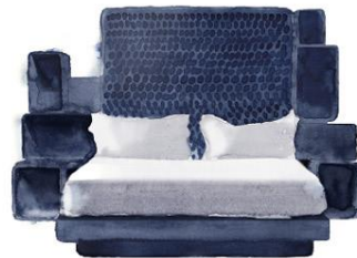
Rundum abgedeckt Mit dem „B Bed“ will Savoir Beds hoch hinaus: Selbst das Kopfteil ist aus Taschenfedern. Und auf den Alcantara-Kuben kann man all seine Lieblingsdinge um sich scharen. Ab 25 405 Pfund. savoirdeds.de