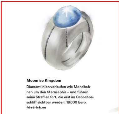
Moonrise Kingdom Diamantlinien verlaufen wie Mondbahnen um den Sternsaphir – und führen seine Strahlen fort, die erst im Cabochonschliff sichtbar werden. 18 000 Euro. friedrich.eu