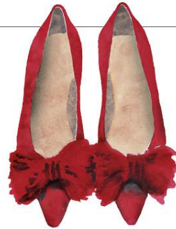
Leichtfüßig Ünötzer fertigt seine Ballerinas – hier aus kardinalrotem Ziegenvelours mit Angoraschleife, 399 Euro – traditionell von Hand. unuotzer.com

Illustration Leonhard Rothmoser Text Nina Luisa Vesic